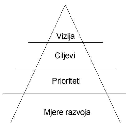
Slika 1: Strategija razvoja pojedinih JLS

Mjere razvoja Općine Kali predstavljaju najvažniji dio Strategije razvoja Općine. Općenito rečeno, mjere su srednjoročni putovi za postizanje prioritetnih ciljeva, a njima se također omogućava iskorištavanje postojećih resursa. Mjere razvoja predstavljaju konkretizaciju strategije, tj. ciljeva i prioriteta. Razvojne mjere služe kao smjer razvoja, koje su na snazi dok se u cijelosti ne postignu postavljeni ciljevi. One su, u tehničkom smislu, most između strateških ciljeva i konkretnih razvojnih projekata. Bez njih planirani razvoj ne bi imao konkretno uporište, te se u konačnici ne bi ni ostvario. Metodom Brainstorminga iskristalizirane su glavne projektne ideje koje su prihvaćene u izradi ovog strateškog dokumenta. U piramidalnoj strukturi mjere su jedini opipljivi i vidljivi dio strategije razvoja pojedine jedinice lokalne samouprave.