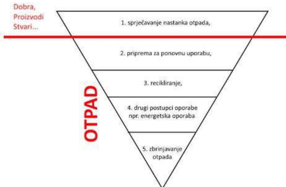
Slika 3. Red prvenstva gospodarenja otpadom