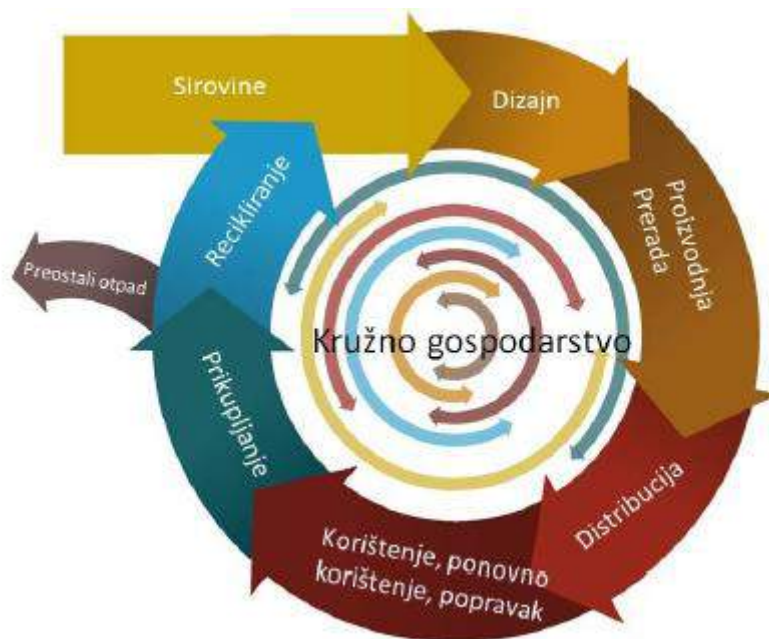
Slika 4. Model kružnog gospodarstva

Za prelazak na kružno gospodarstvo potrebne su promjene u cijelom lancu vrijednosti, od učinkovitog upravljanja resursima, dizajna proizvoda, novih poslovnih i tržišnih modela, novih načina pretvaranja otpada u resurse do novih modela ponašanja potrošača.